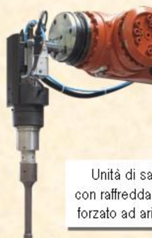
Unità di saldatura US con raffreddamento interno forzato ad aria compressa