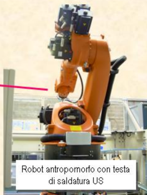
Robot antropomorfo con testa di saldatura US