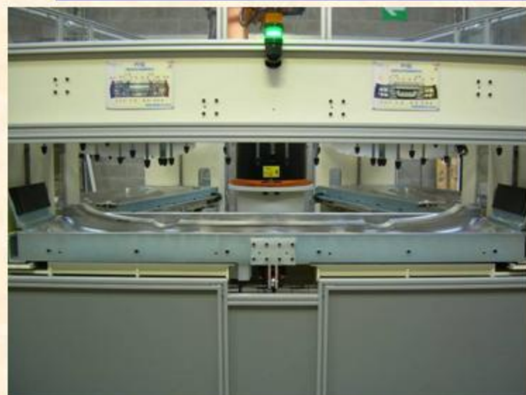
Varco tecnico di carico