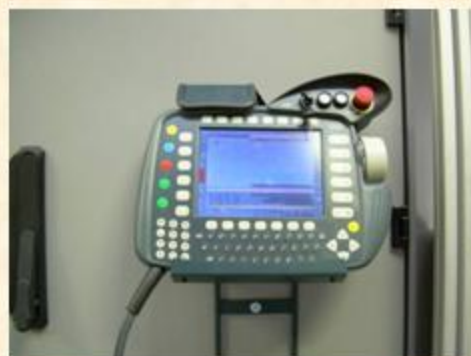
Tastiera di comando per Robot KUKA KCP2